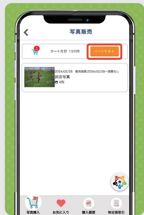
① 「カート見る」をタップ