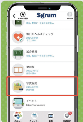
① アプリトップページの「写真販売」をタップ