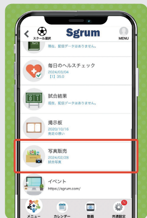
① アプリトップページの「写真販売」をタップ