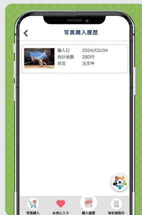
③ 購入履歴の確認ができます