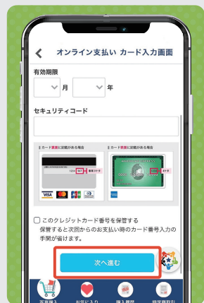
④ カード情報を入力し、「次へ進む」をタップ