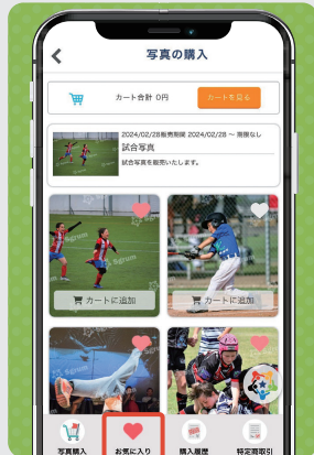
④ 「お気に入り」をタップ