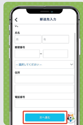
③ 配送先住所を入力し、「次へ進む」をタップ