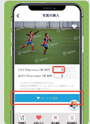
④ 枚数を入力し、「カートに追加」をタップ