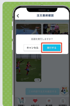
⑥ 「実行する」をタップ