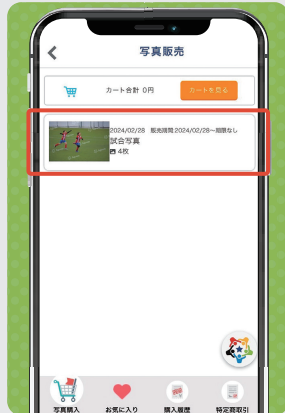
② 購入したい写真のあるアルバムをタップ