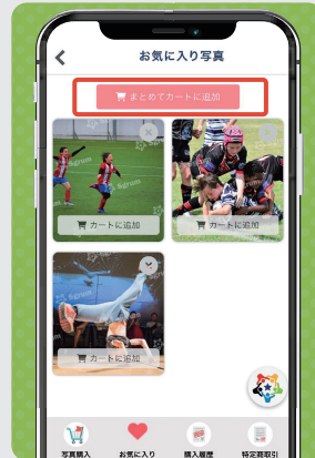
⑤ 「まとめてカートに追加」をタップ