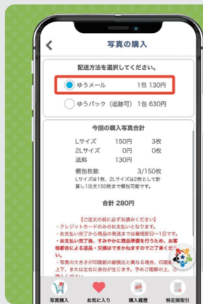
② 配送方法を指定し、「購入手続きに進む」をタップ