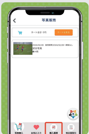
② 「購入履歴」をタップ