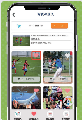
③ お気に入りに登録したい写真の「♥」をタップ