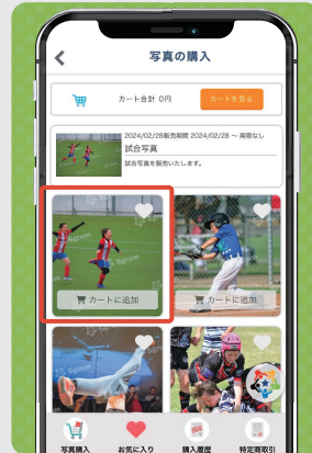
③ 購入したい写真をタップ ※お気に入りに登録すると複数の写真の選択が可能